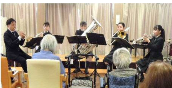
軽快で迫力ある金管五重奏