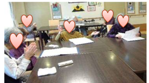
Yさんの音頭で歌う炭坑節、手拍子を打って楽しそう