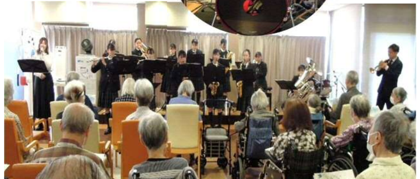
OGの女性と一緒に『ふるさと』などを歌いました