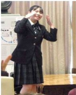
『上を向いて歩こう』では振りをつけて