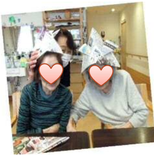
かぶりたいと新聞紙で大きな兜を作りました