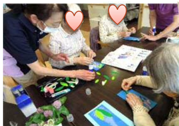
藤の花は絵具で書きました