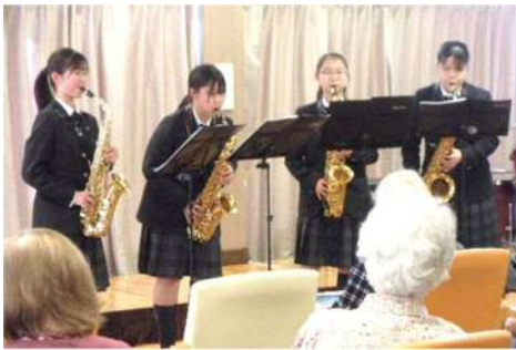
やわらかさとダイナミックさが魅力の木管四重奏