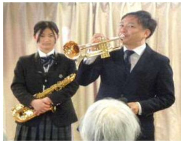
トランペットの紹介で、競馬のファンファーレ後のコケッココ〜に大笑い