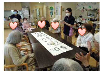
娘さんが作ってくれた得点ゲームで盛り上がります

ご利用者様に教えられることも多く、「ありがとう」という言葉に励まされています。ご利用者様が安全に笑顔で過ごしていただけるよう「実務者研修」の資格を取りスキルを上げたいと思っています。